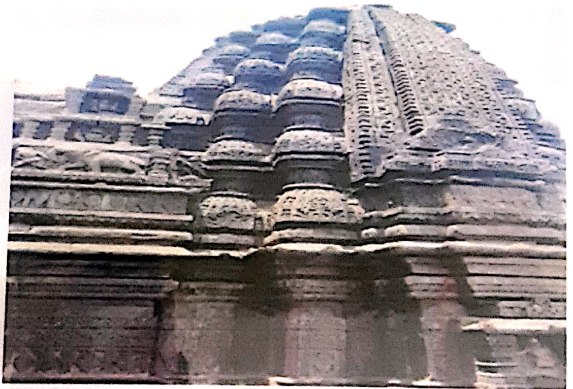
Ancient Hemadpanthi Temple - Sakegaon, Tq.Chikhli. Dist.Buldana.