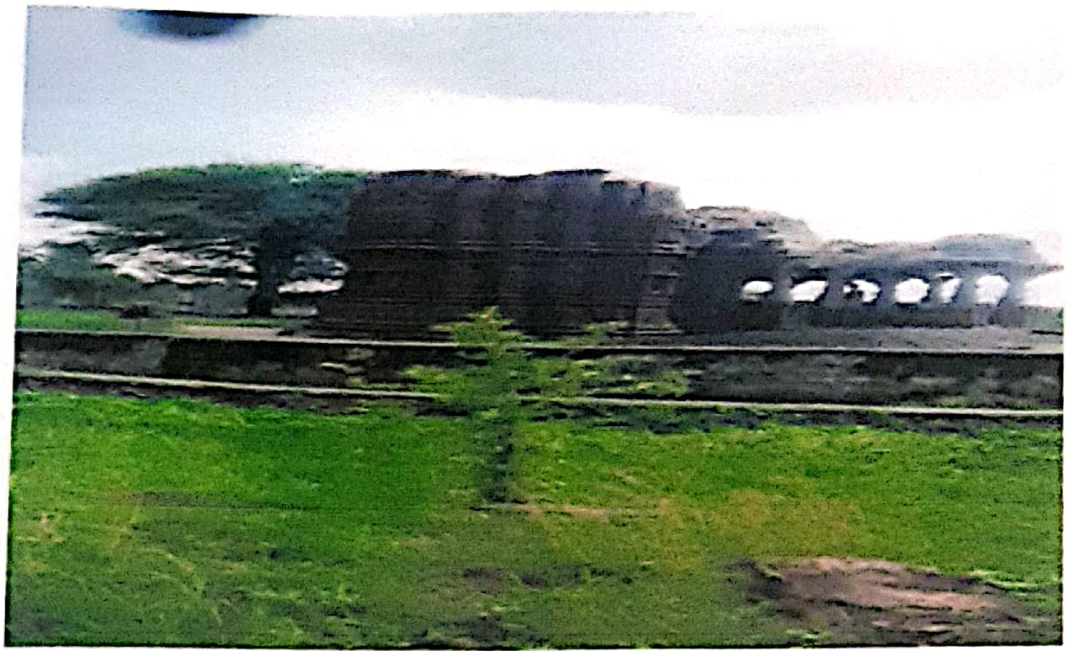
Ancient Hemadpanthi Temple - Satgaon Bhusari Tq.Chikhli. Dist.Buldana.