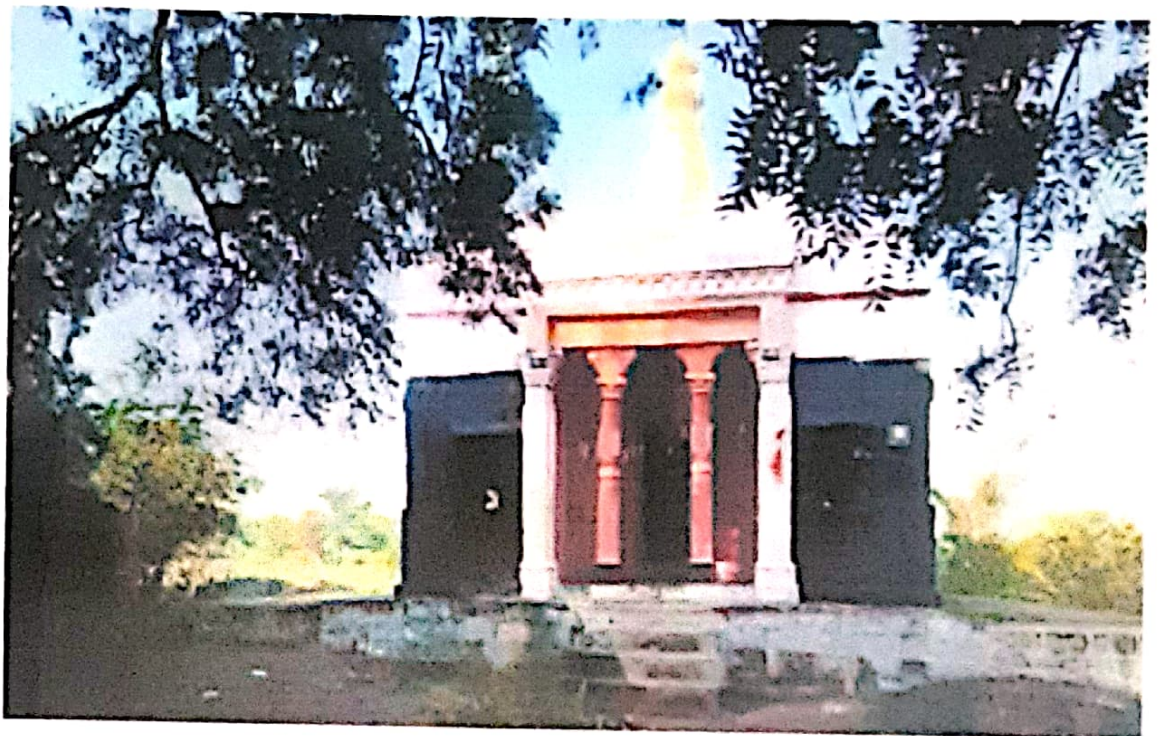
Shiva's Ancient Temple - Amdapur, Tq.Chikhli. Dist.Buldana.