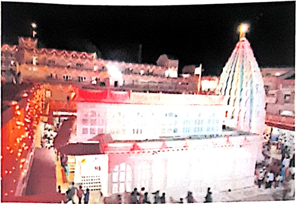
Renuka Mata Temple Tq.Chikhli. Dist.Buldana.