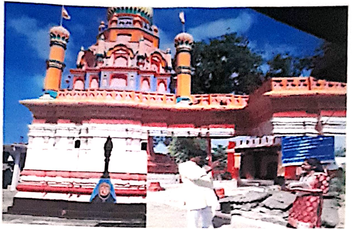
Ancient Temple of Ballal Devi - Amdapur. Tq.Chikhli. Dist.Buldana.